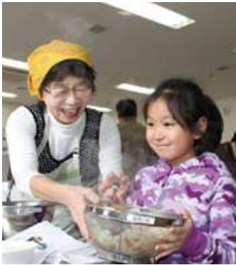
留学生達を料理講師に迎えてのモンゴル料理教室。大人から子供まで楽しめます。