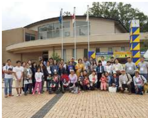
モンゴル人の参加者の多さにビックリ!! 協会としても大変嬉しい企画でした。