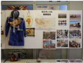
①団体紹介パネル展示

「いしかわで世界を体感!世界のひとたちとふれあおう」を合言葉に25ヶ国、36の団体が参加した。参加プログラムは①団体紹介パネル展示②ステージショー③団体紹介ブース④世界の料理屋台の四つであった。今年は私たちの協会は4部門全部に参加した。