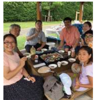
モンゴル人は「お肉が大好き!!」自然と笑顔がこぼれます。