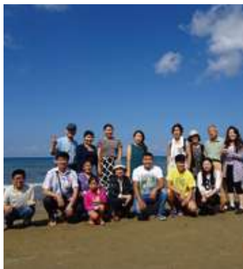
留学生達と一緒に千里浜や、能登島水族館への小旅行。とても楽しかったようです。