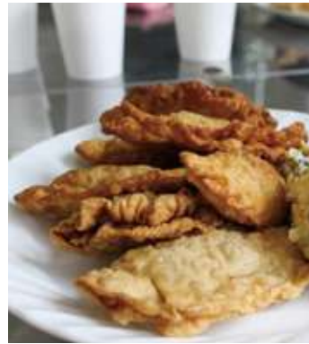
はじめてにしては上出来!? モンゴルの家庭料理は日本人にも大好評です。