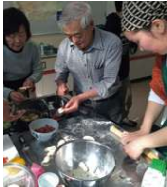
皆で料理を作るというのは、お互いを知る文化交流にはピッタリ！