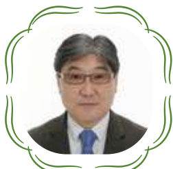
駐日モンゴル国 臨時代理大使 ダンバダルジャー バッチジャルガル様

石川・モンゴル親善協会の皆様 石川・モンゴル親善協会創設 10周年おめでとうございます。